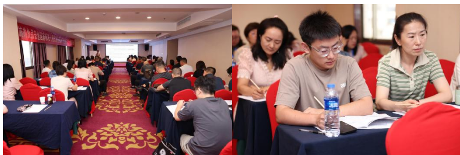
公共营养师培训照片